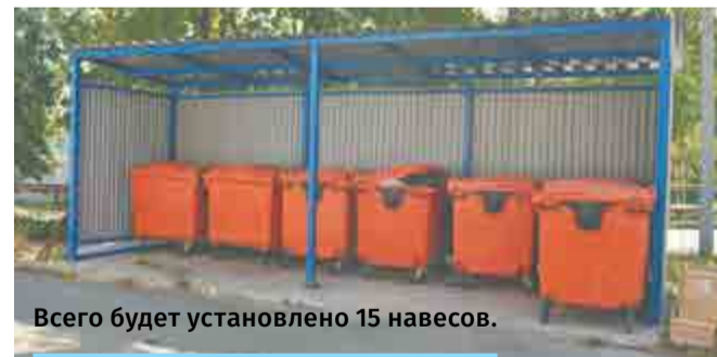
Всего будет установлено 15 навесов.

Места временного хранения цеховых отходов оборудованы металлическими навесами.